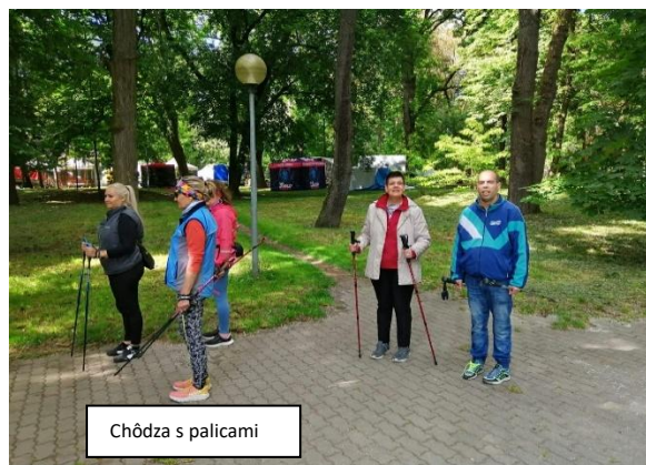
Chôdza s palicami