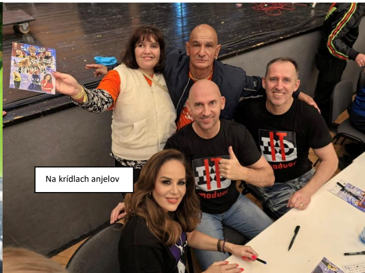
Na krídlach anjelov