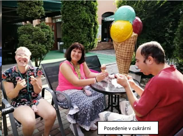
Posedenie v cukrárni