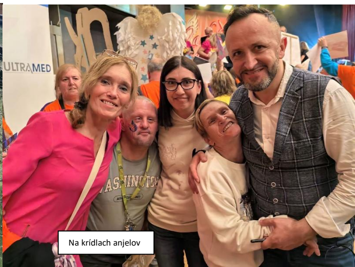
Na krídlach anjelov