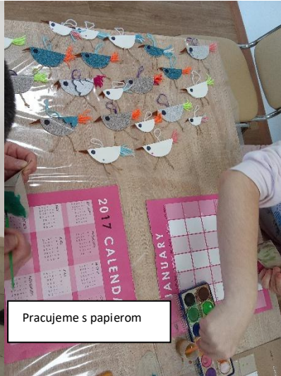
Pracujeme s papierom