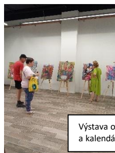
Výstava obrazov a kalendárov