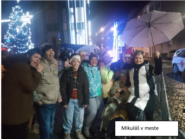
Mikuláš v meste