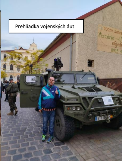
Prehliadka vojenských áut