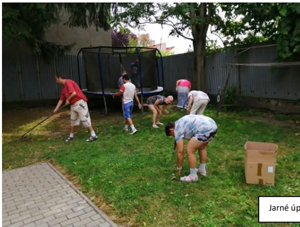
Jarné úpravy na dvore